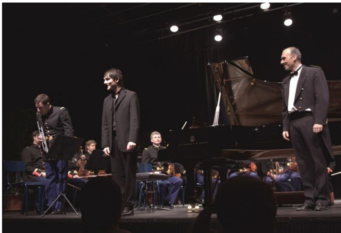
Avec l'orchestre de la Garde républicaine : Concerto n°1 de Chostakovich